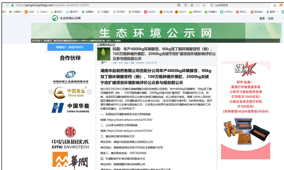
图5 报批前网络公示截图

本次公示主要内容及日期均符合《环境影响评价公众参与办法》（生态环境部令第4号）“第二十条”的要求。