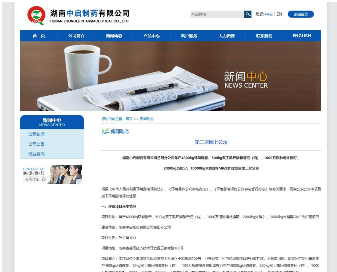
图 2 征求意见稿网上公示截图